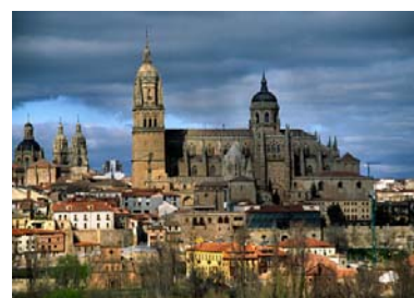
Vista de la ciudad de Salamanca

Además, la Universidad controla la concesión y el desarrollo académico de los certificados DELE (el modelo fijado para el control de los conocimientos de español en alumnos extranjeros) y cuenta con uno de los mayores centros de formación para extranjeros.