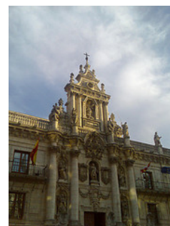
Universidad de Valladolid

Además, la Consejería de Cultura y Turismo ha creado una Comisión de Coordinación del Plan de Español. Entre sus principales funciones desatacan la coordinación de los distintos órganos y entidades, el impulso del desarrollo y ejecución de los trabajos y actividades del Plan, actuando, además, como observatorio institucional del sector.